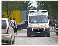
Anziano travolto e ucciso da un'auto Ardea, frontale tra 3