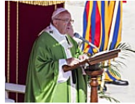
Il Papa ai catechisti: non irrigidirsi su doveri morali, Dio ci