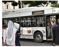
Sciopero a Roma, traffico paralizzato Metro e bus fermi dalle