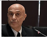
Lavoro e alloggio per 75mila profughi: il piano del governo