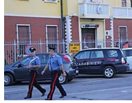
Pomezia, arrestata la banda che rapinava benzinai e tabaccai